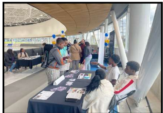
Journée d'accueil des nouveaux arrivants