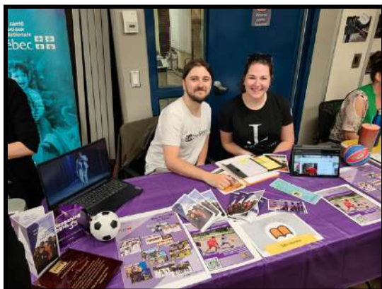
Activité de réseautage avec le centre multiethnique